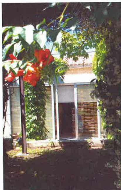
Bibliothèque vue du jardin

L'équipe municipale et moi-même vous souhaitons une bonne reprise de travail.