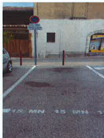
Stationnement 15 minutes Place Docteur Gabriel

Réalisé en concertation avec les commerçants, le stationnement "minute" rue de la République et place Dr Gabriel semble être apprécié. Le but étant de permettre d'avoir accès aux commerces plus facilement et d'optimiser une rotation des véhicules.