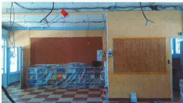
Câblage électrique en cours

Les travaux ont été réalisés par l'entreprise Nono placo & associé.