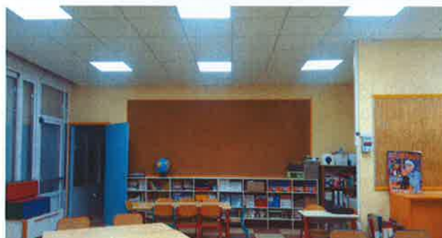
Tous travaux exécutés